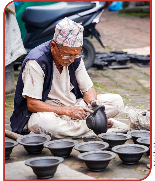
# Skilled Hands