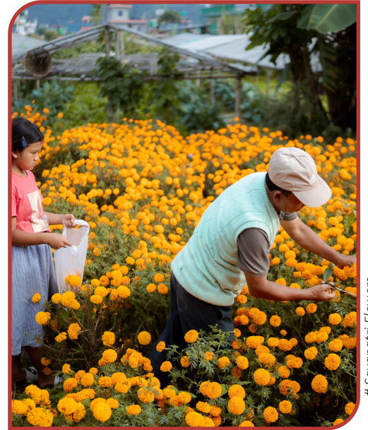
# Sayapatri Flowers