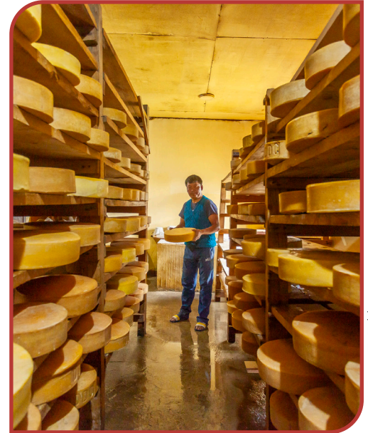
# Farm To Table